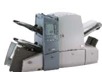
DI500 Brzina rada 3600 OMR