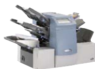
DI380 Brzina rada 3000 OMR