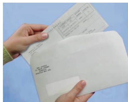
I na kraju, ubacite ga u koverat. Pazite da se adresa vidi u prozoru. Prava gnjavaža od posla, zar ne?